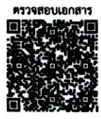
ตรวจสอบเอกสาร